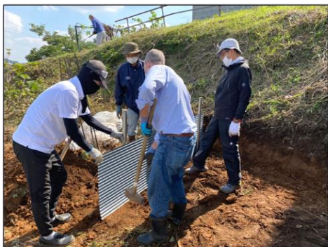
杭をしっかり打ち込んで 草などを捨てるゴミ捨場の完成