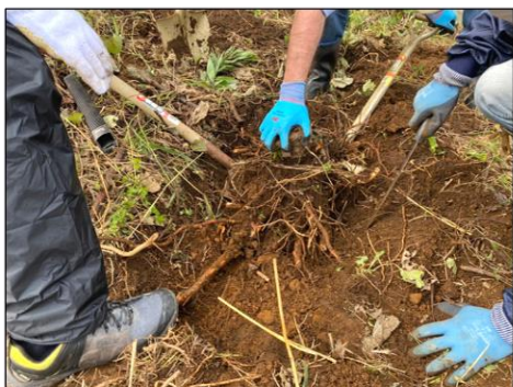
大きな根っこがゴロゴロ手ごわい