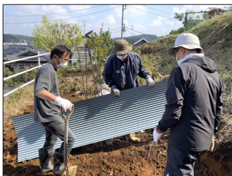
草置き場用の仕切りを立てます