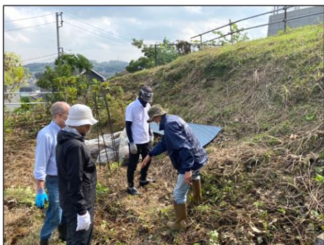
作業前の様子、工事プラン説明中