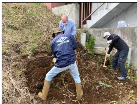
粘土質の固い斜面を削ります