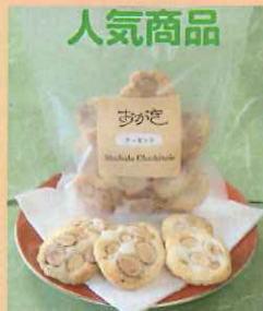
人気商品 アーモンド