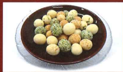
新商品 食感豊かな豆菓子です