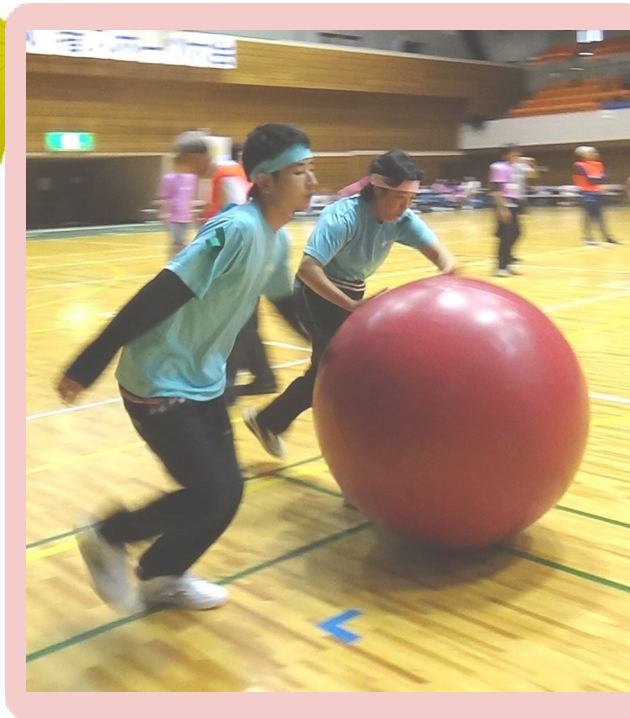
第46回 障がい者スポーツ大会の一枚 (町田おかしの家より)