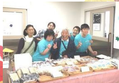
町田おかしの家 祭りにて