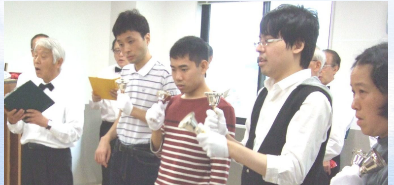
(理事長写真左) リタイアリーズ (理事長が所属している男声合唱団)の コンサート 利用者とのコラボレーションの様子