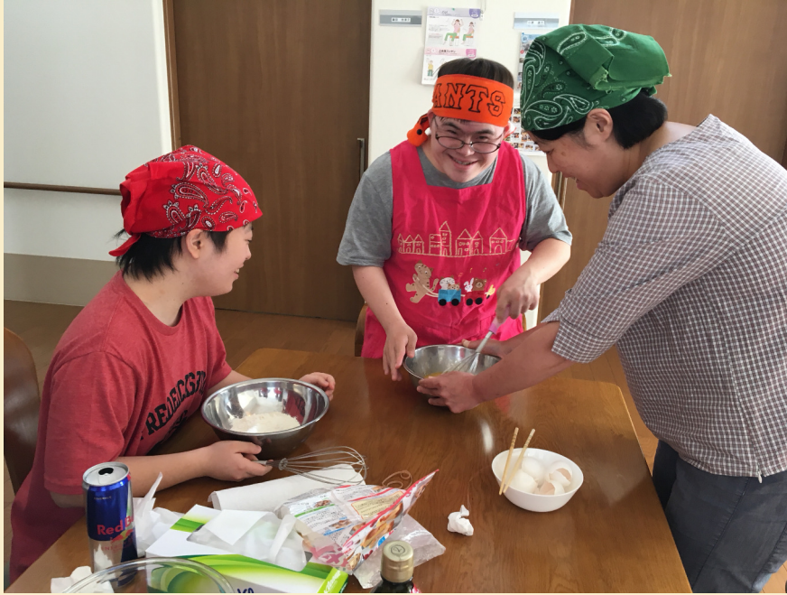
パウンドケーキを作りました。 (ケアホーム愛の鈴より)