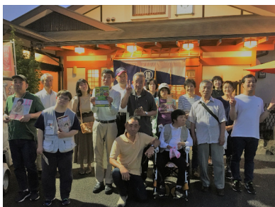
近所で皆さんと会食