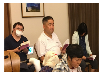
防災について、冊子を読んで勉強をしました