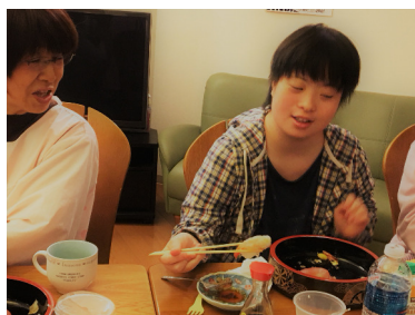
ようこそ! よろしく!

開設以来、皆さんの「お兄さま」と慕われてきたI Oさんの送別会を行いました。(写真左)