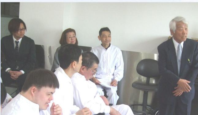
入所式での理事長の言葉 (理事長写真右)