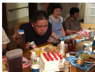
全員でお祝いをしました