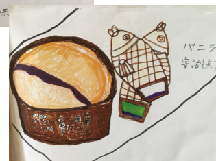
手描きのランチョンマットをみんなで作りました (写真右)