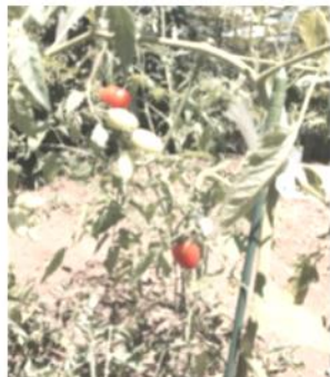
菜園にもミニトマトが実りました