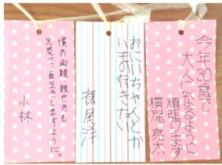
短冊に願いを込めました。