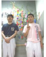
お野菜 レインボー新聞 七夕