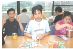
8月生まれ Nさん YRさん ONさん

ケーキをかこんで、ハッピーバースデーの歌をギターやキーボードを使いながら歌い、みんなで誕生日のお祝いをしました。 (バースデーカードやインタビュー・写真他は館内に掲示しています。)