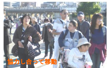
協力し合って移動