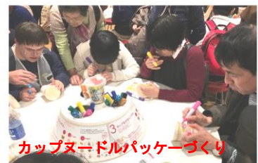
カップヌードルパッケージづくり