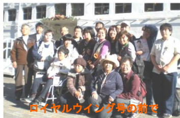
ロイヤルウイング号の前で