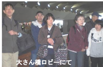
大さん橋ロビーにて