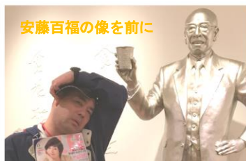
安藤百福の像の前に